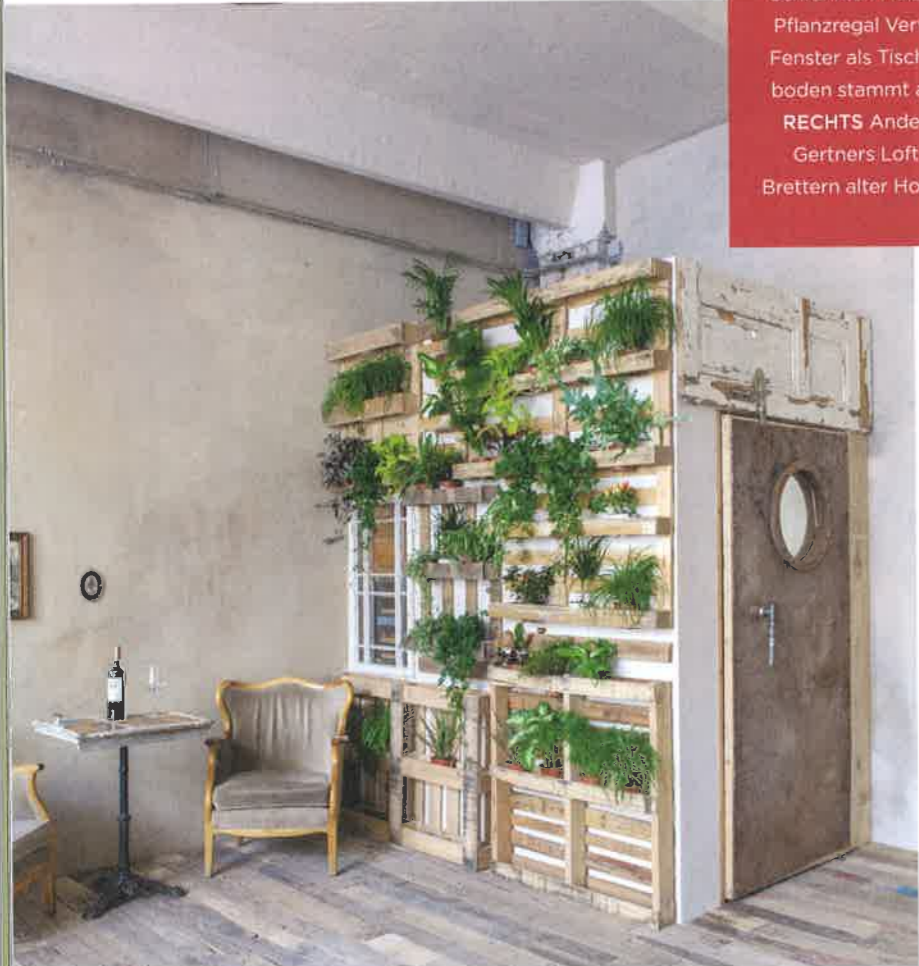
Die Wandfarbe „Drop Cloth“ Nr. 283 von Farrow & Ball rahmt den Naturlook perfekt ein