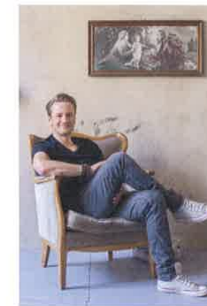
Leben wie ein Gertner? Er vermietet weitere Lofts in der Fabrik, www.the-berlin-loft.com